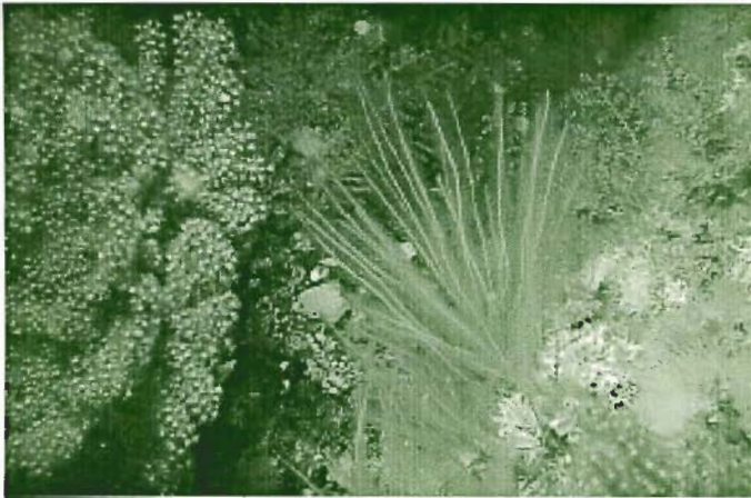
HIDROIDEOS Y GORGONIAS (Bahía Norte)