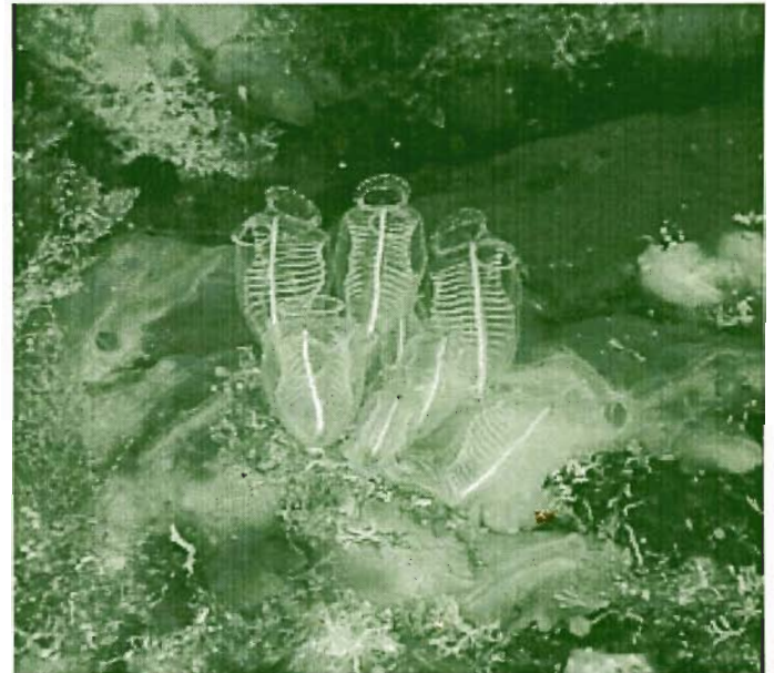
ASCIDIA SOCIAL (Bahía Norte)