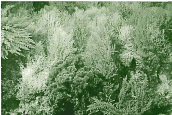
PRADERA DE ALGAS FOTÓFILAS (Bahía Norte)