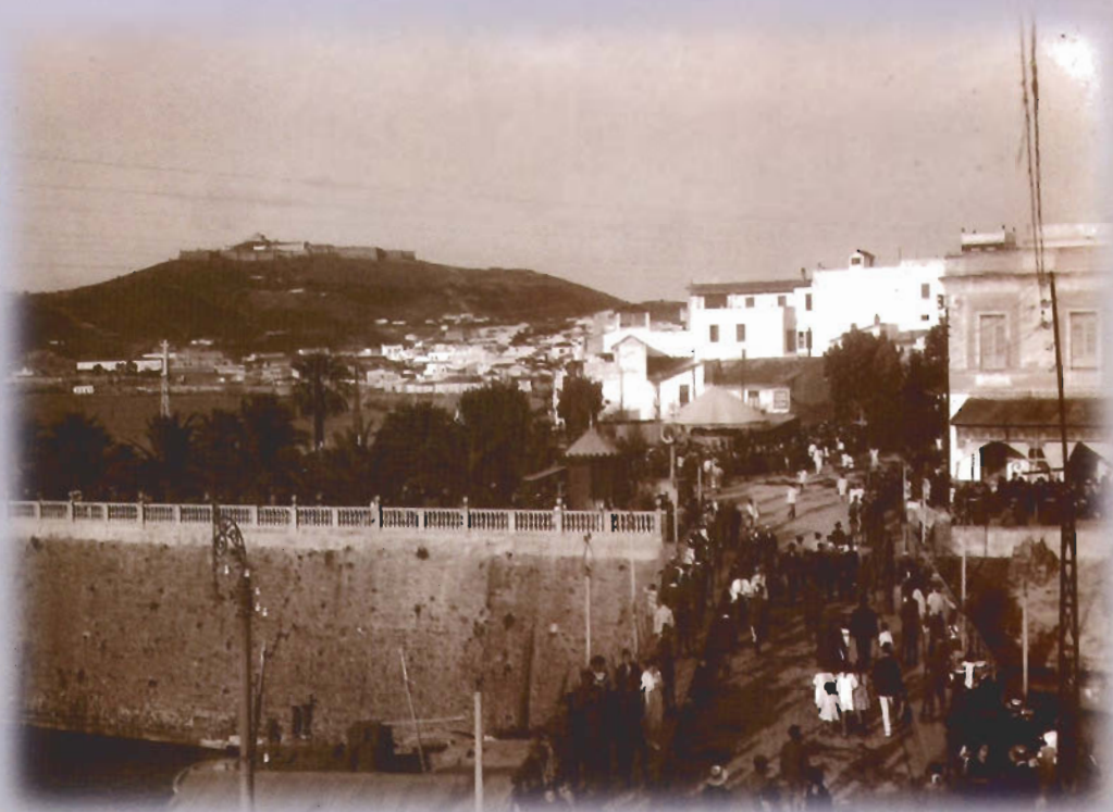
Puente Almira (hacia 1920). Los edificios del fondo se demolieron para construir la casa Trujillo.