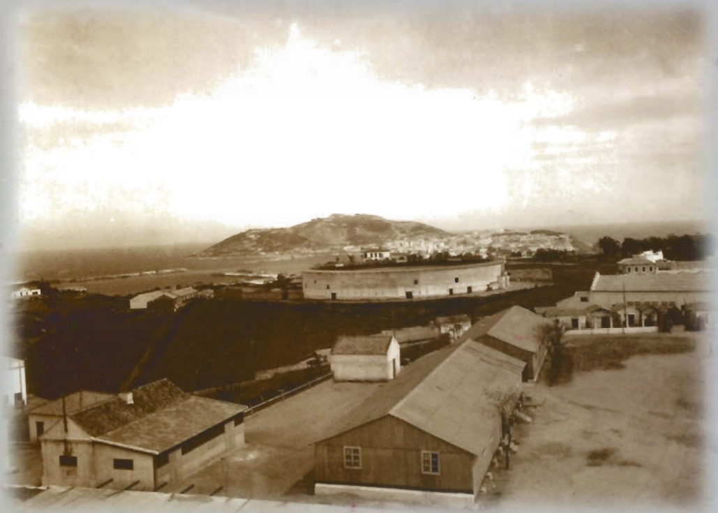
Ceuta con la plaza de toros de Hadú. Detrás de la plaza se divisa el Pabellón Otero