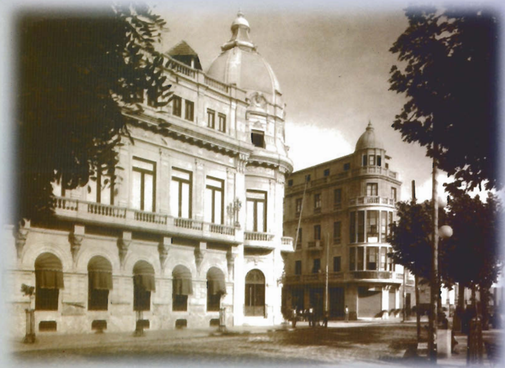
El Ayuntamiento de Ceuta según proyecto del arquitecto D. José Romero Borrero