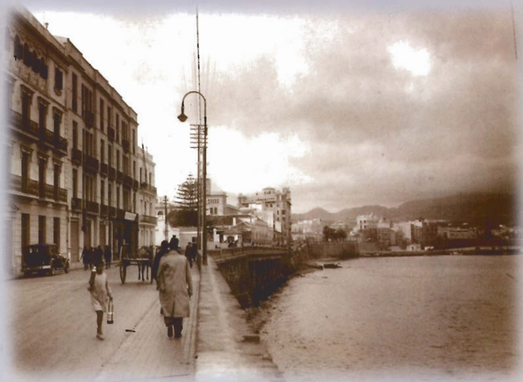
Paseo de la Marina