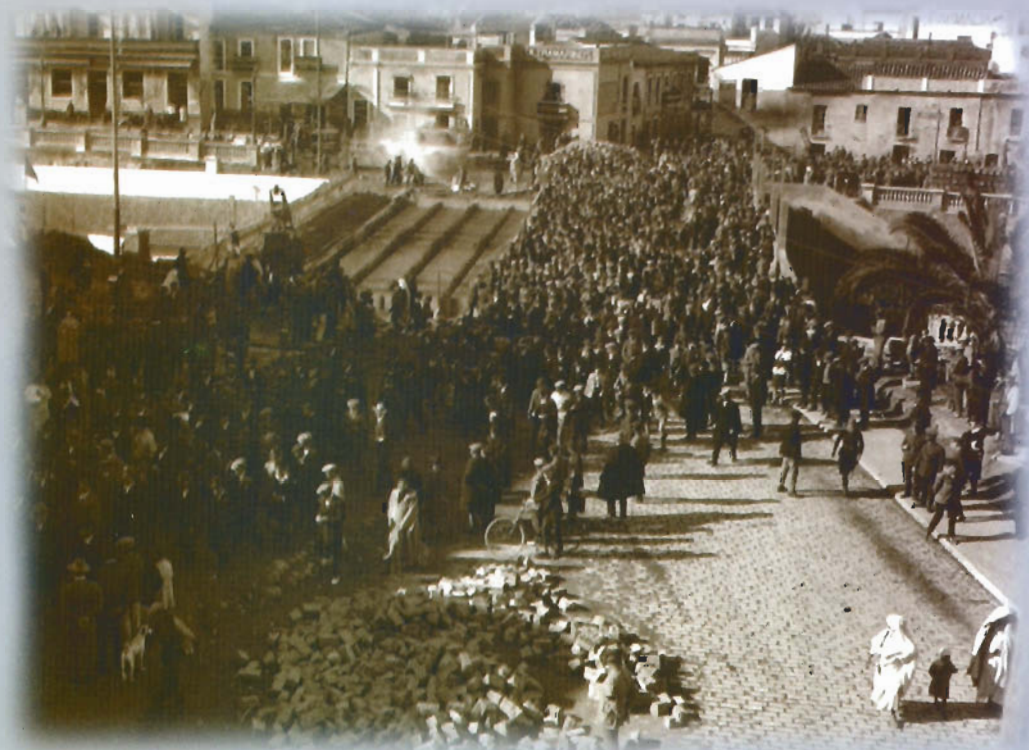
Ampliación del puente Almina (hacia 1928). Vista desde los Jardines de San Sebastián