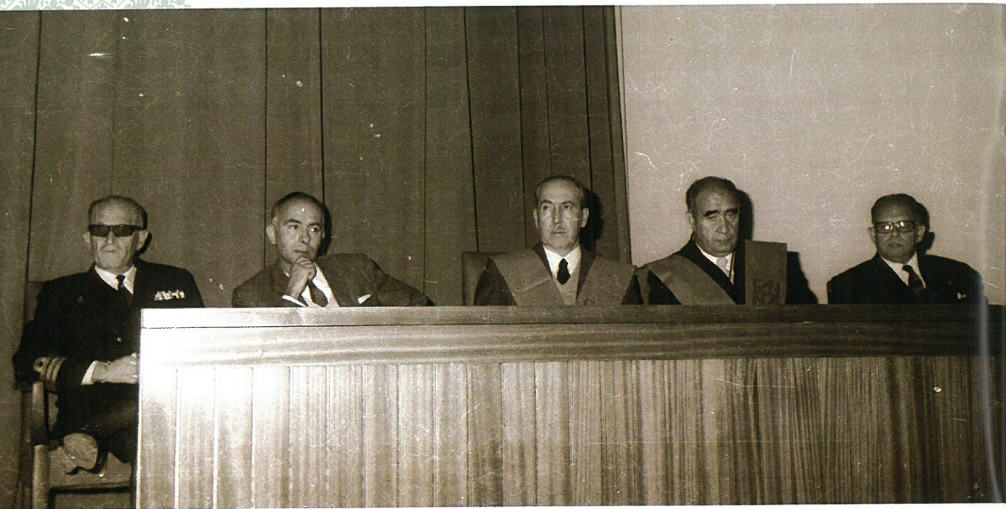
Presidencia con autoridades locales y dirección del Centro.