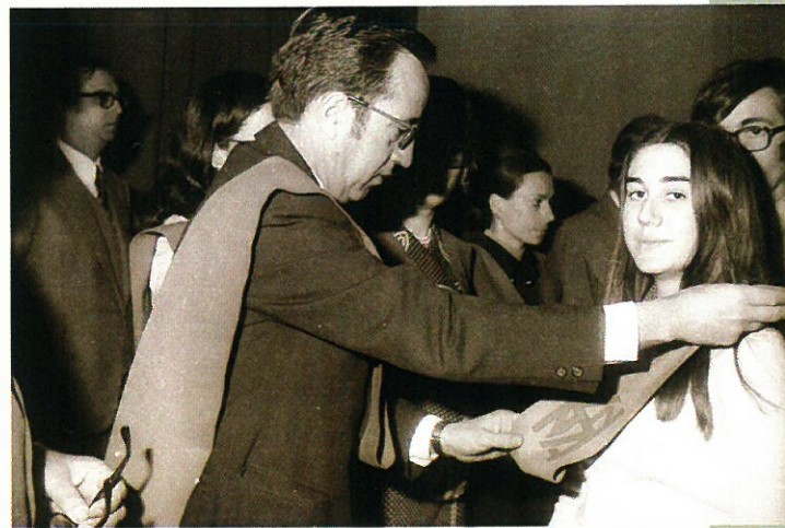
Imposición de becas y entrega de diplomas a los alumnos.