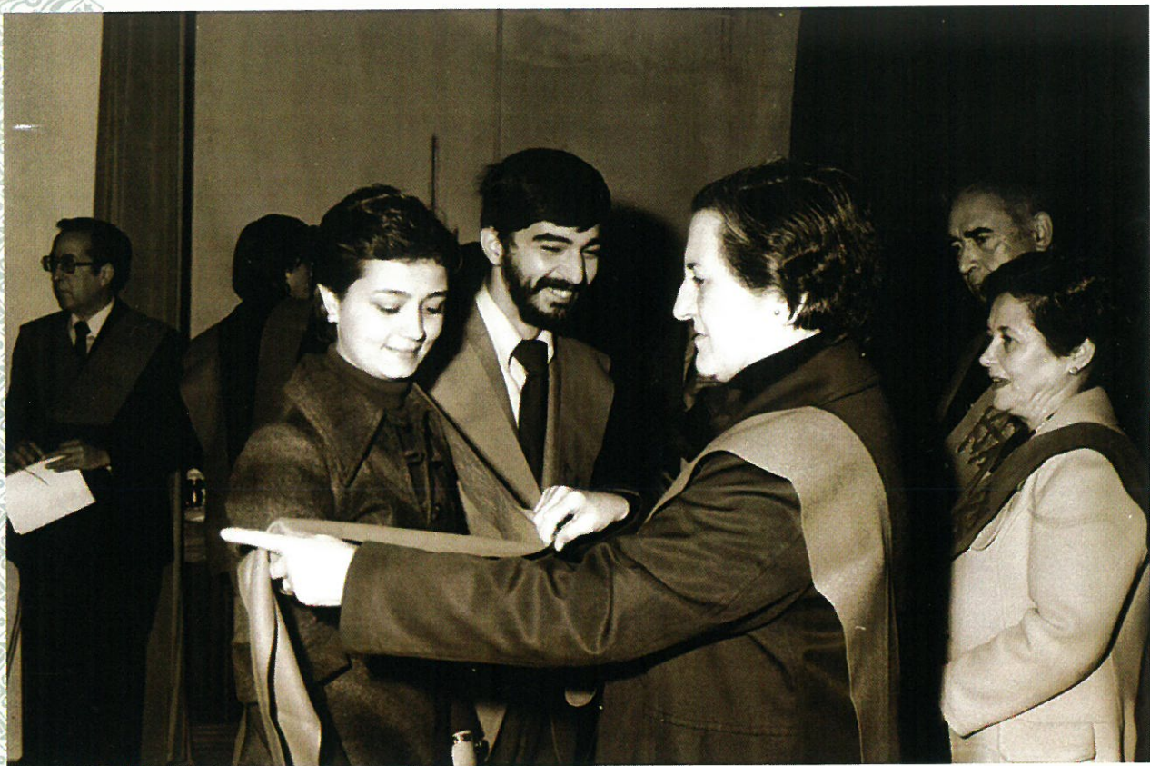
El emocionante momento de la imposición de becas.