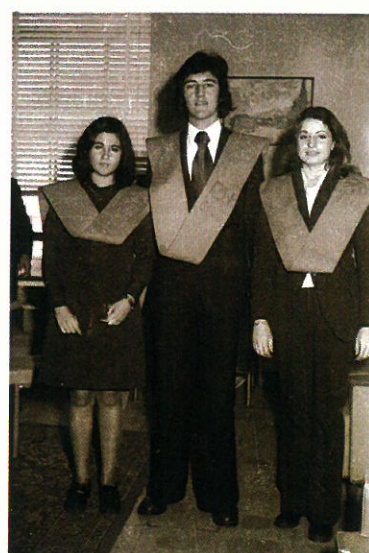
Grupos de alumnos el día de la festividad patronal.