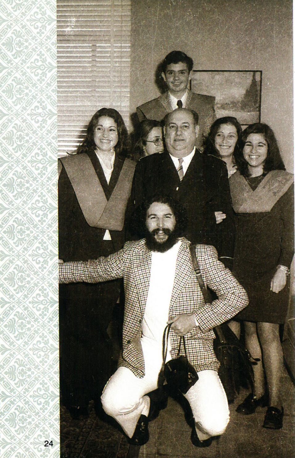
Alumnos posando con el Conserje de la Escuela.