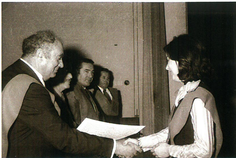
Profesores y autoridades locales entregando diplomas.