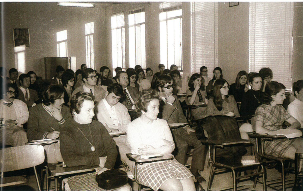
Aula de la Escuela de Magisterio.