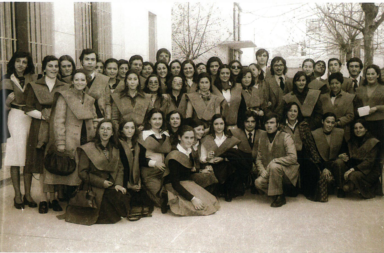
Grupo de alumnos de primer curso posando ante la fachada de la Escuela.