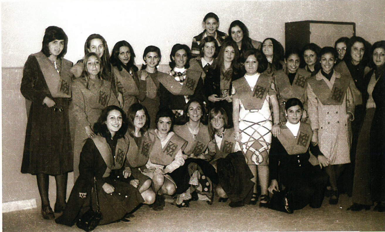
Grupos de alumnas el día de la festividad del Patrón.