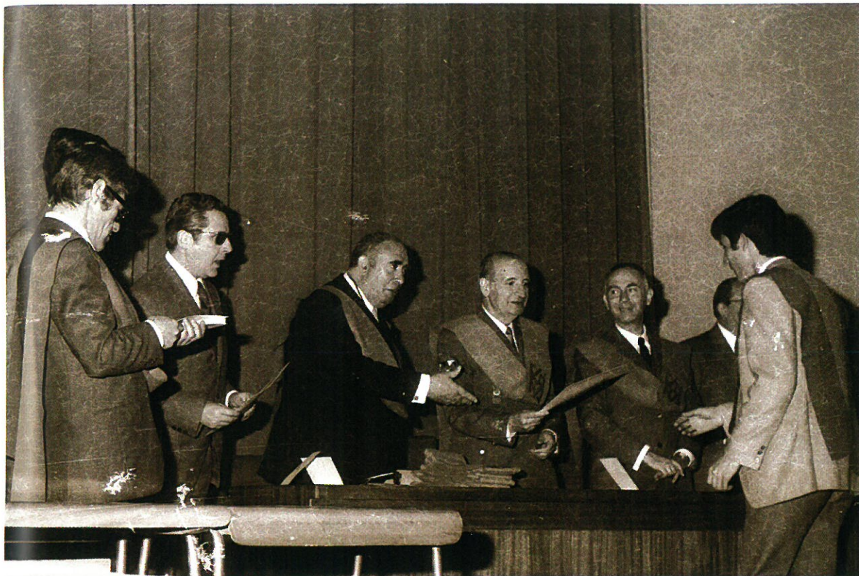
Aspecto de la mesa presidencial en el transcurso del Acto Académico.