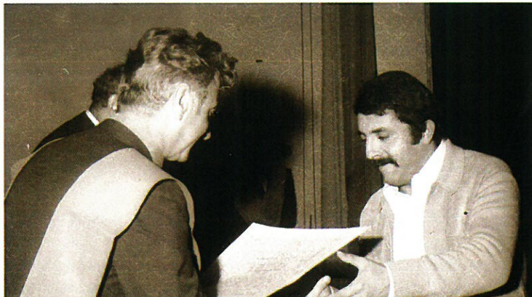
Entrega de diplomas.