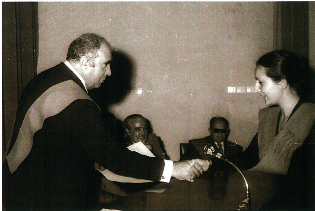
Entrega de diplomas.