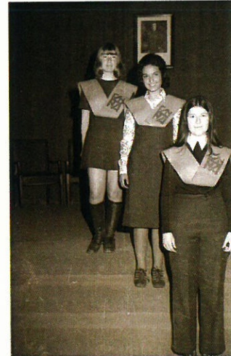
Alumnas de primer curso tras la imposición de becas.