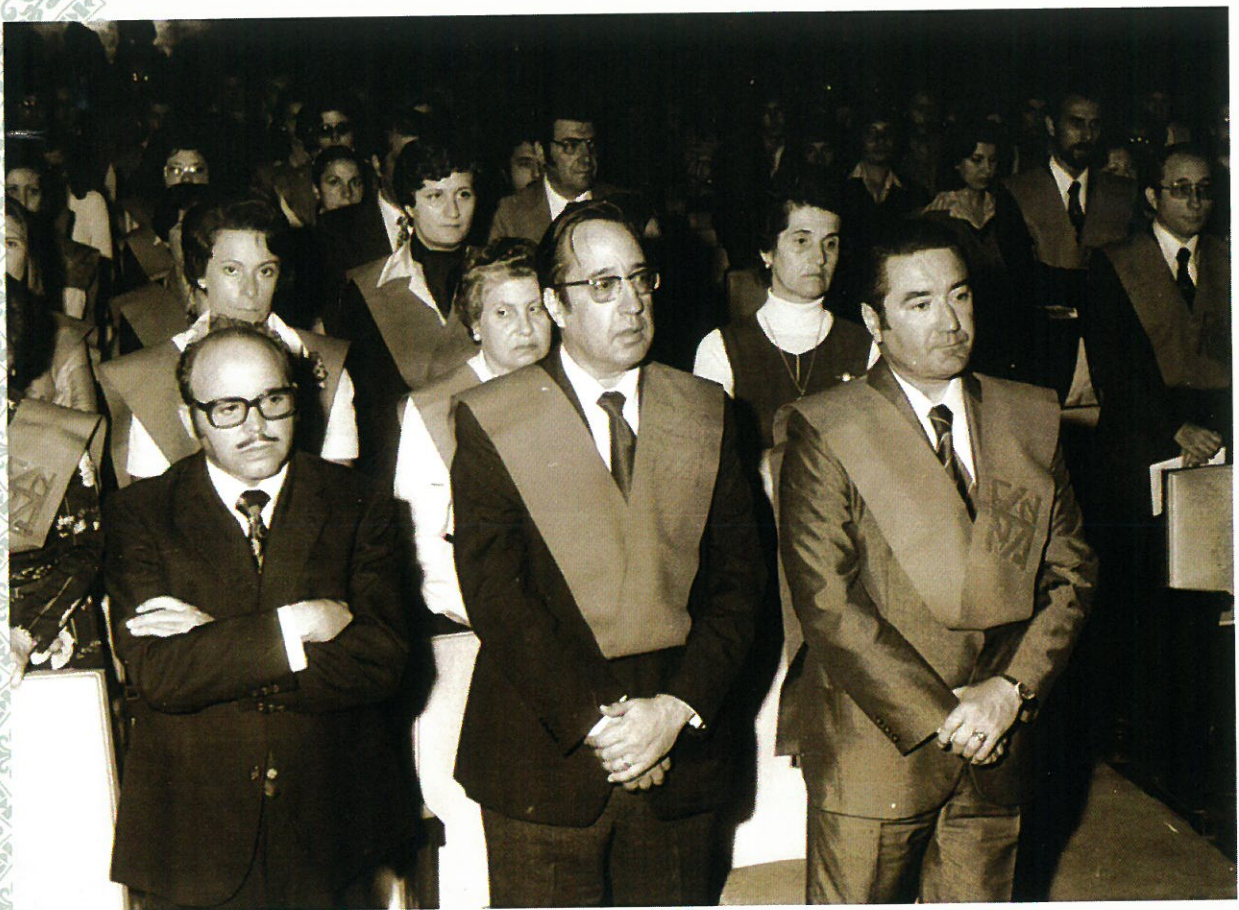
Asistentes al Acto Académico de Santo Tomás.