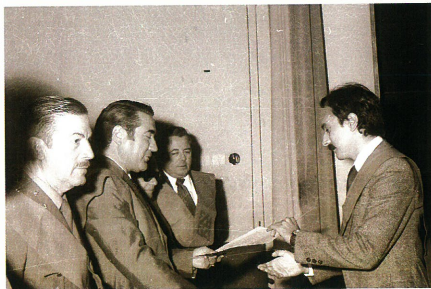
El Comandante General Gutiérrez Mellado y el Alcalde Sotelo Azorín participando en los actos con motivo de la festividad de Santo Tomás de Aquino.