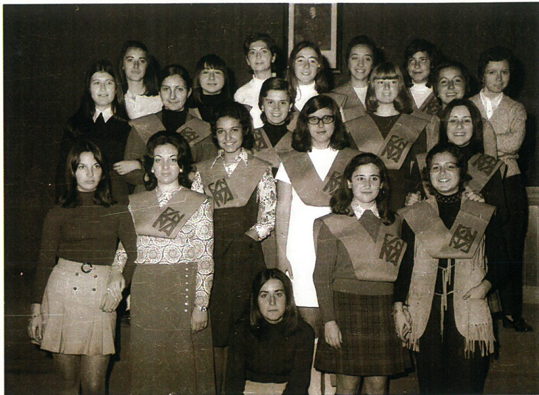
Alumnas de primer curso posando en grupo tras la imposición de becas.