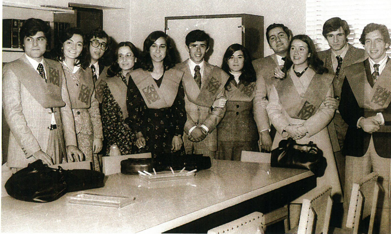
Grupo de alumnos en la antigua Sala de Profesores de la Escuela.