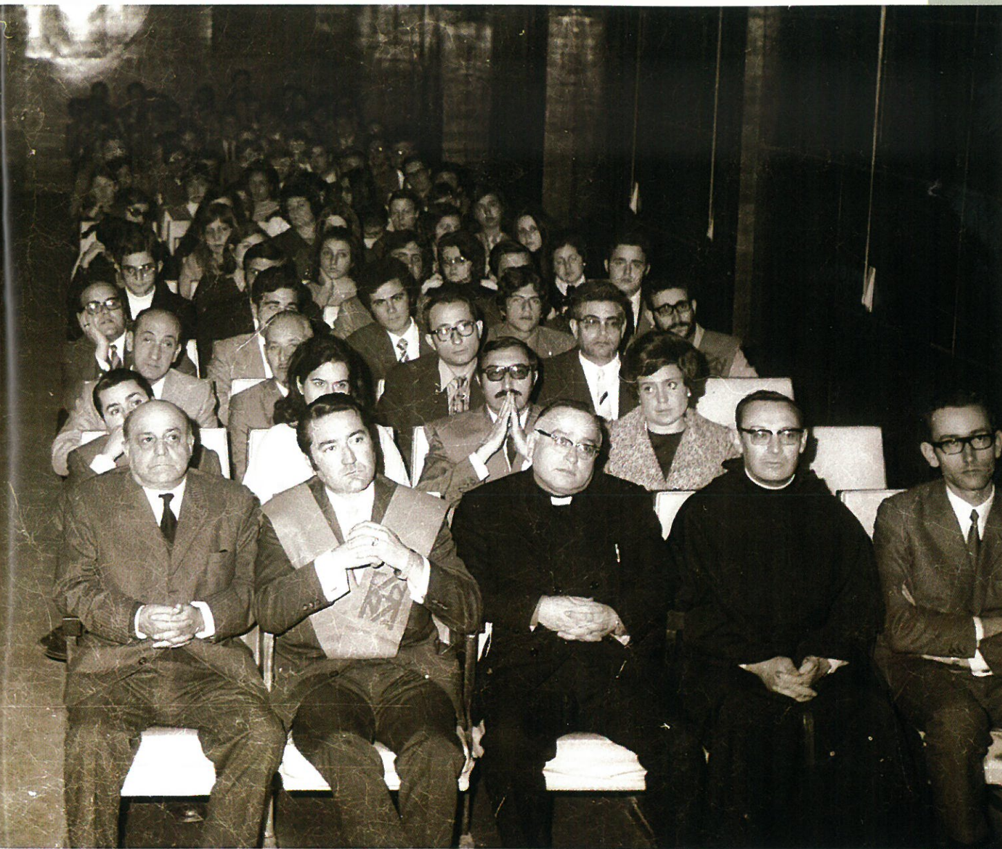
Festividad de Santo Tomás de Aquino. Aspecto del salón de actos.