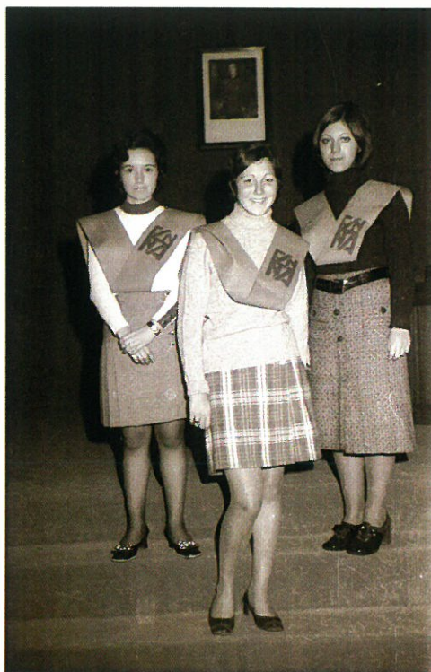
Alumnas posando tras la imposición de becas.