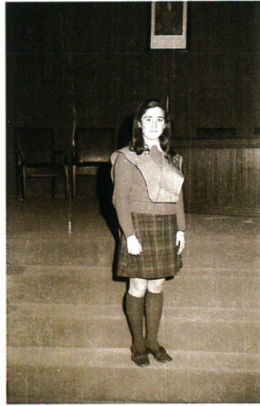
Alumnas de primer curso.