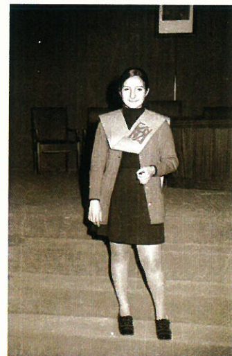
Alumnas de primer curso tras la imposición de becas.