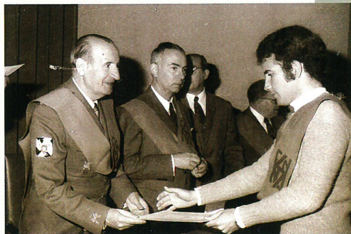
Profesorado y Autoridades en la imposición de becas y entrega de diplomas.