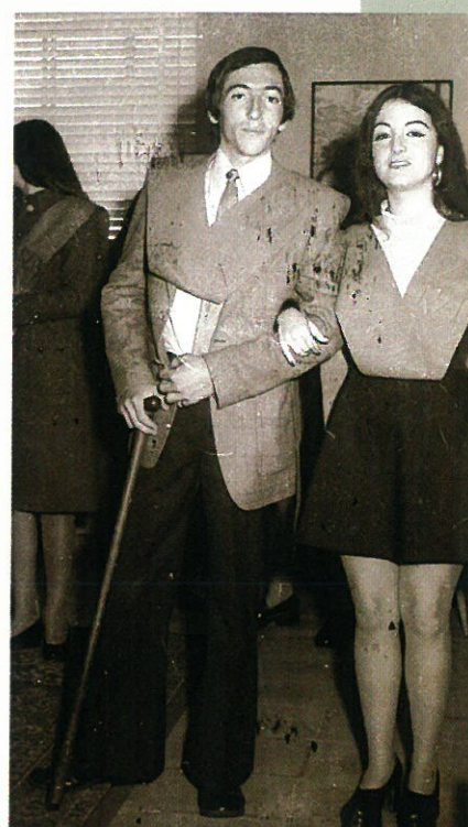
Alumnos con sus "padrinos y madrinas" tras la imposición de becas.