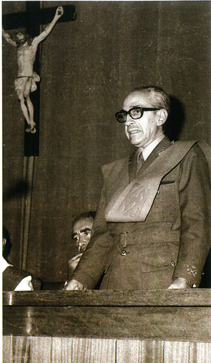
El Comandante General Gutiérrez Mellado dirigiéndose a los asistentes del Acto Académico.