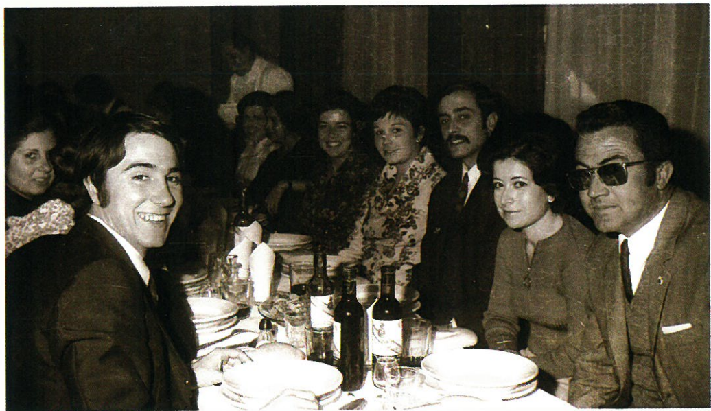
Tradicional almuerzo con motivo de la festividad de Santo Tomás de Aquino.