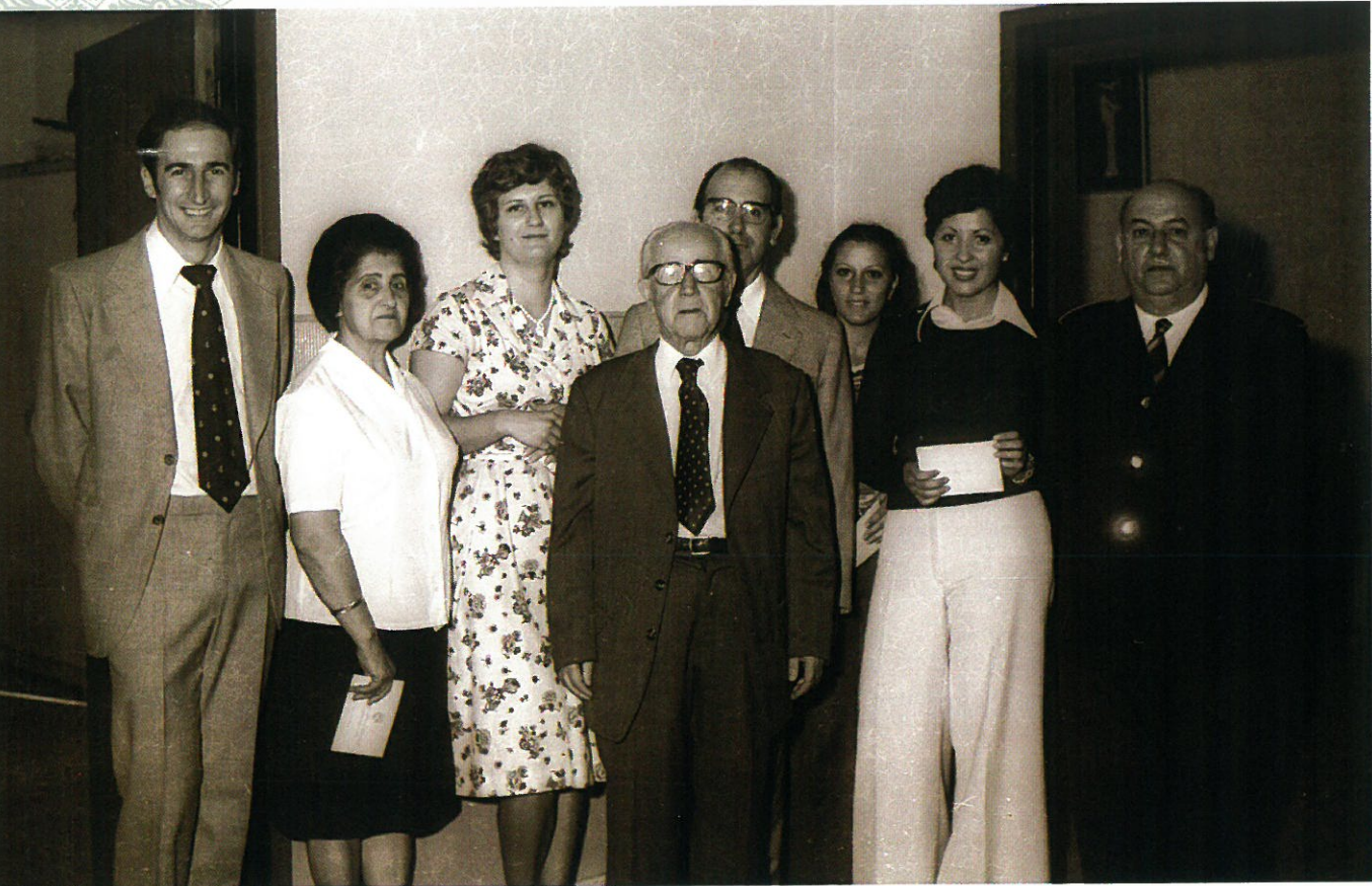
Personal de Administración y Servicios.