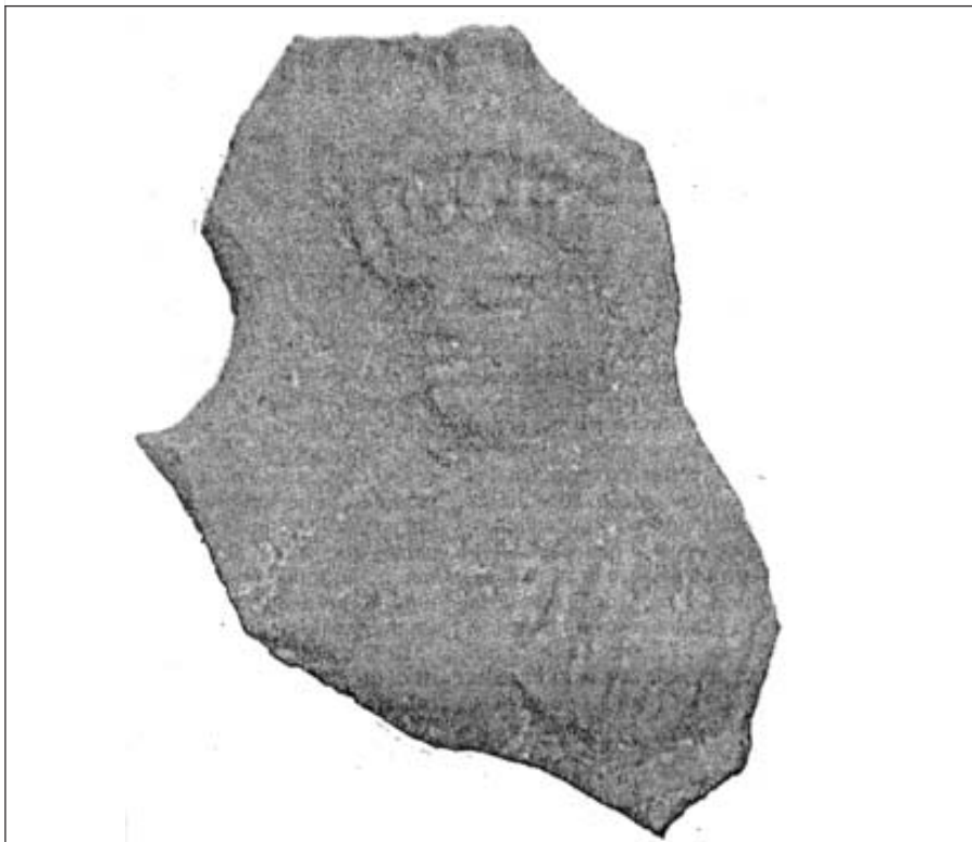
Fragmento de una lucerna hallada en la excavación de la Puerta Califal.