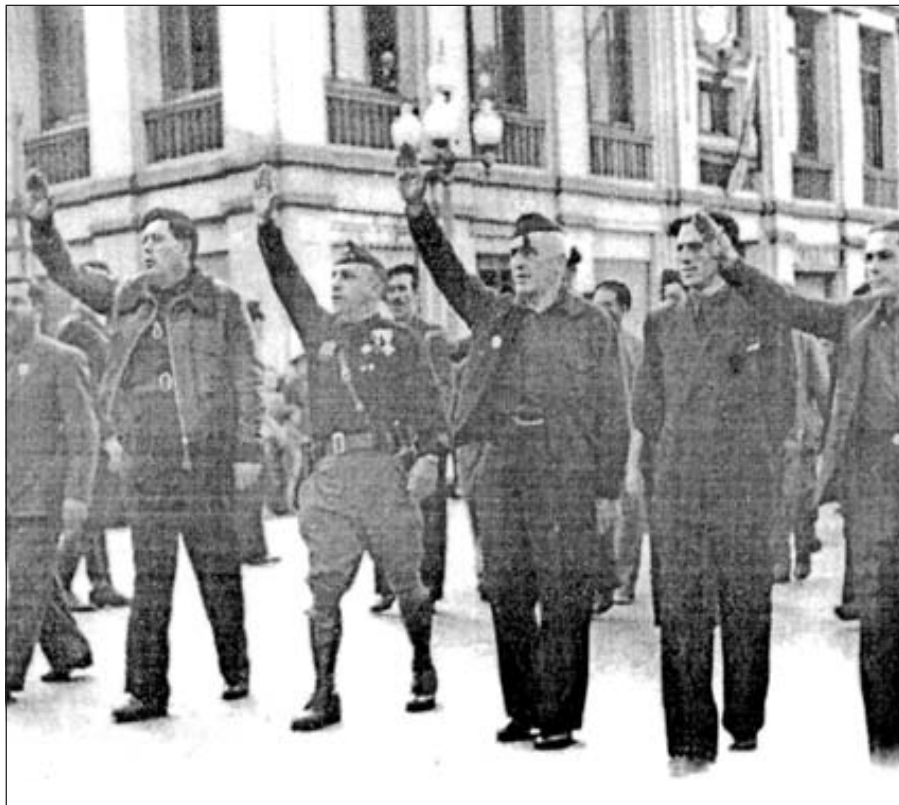
Acto organizado por las Organizaciones del Movimiento al paso por el Puente de la Almina a la altura del Mercado Central, hacia 1945