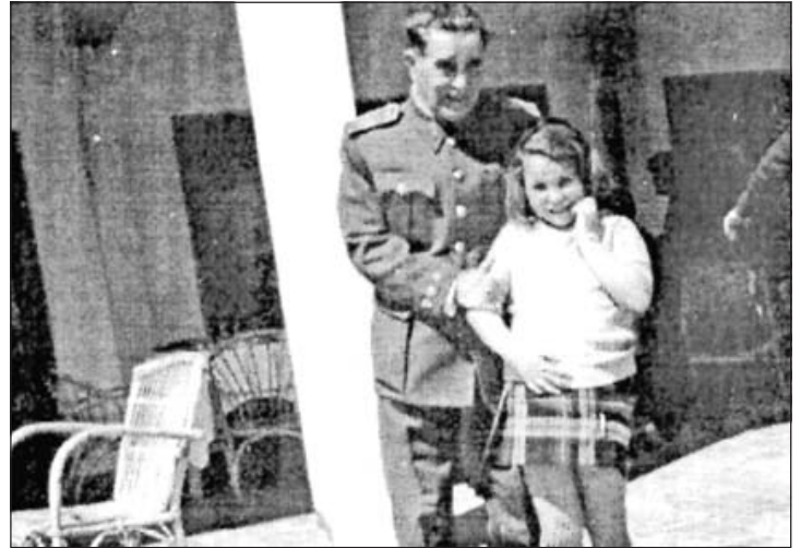
Con su padre que era militar y al que adoraba. Lo perdió con 12 años de edad