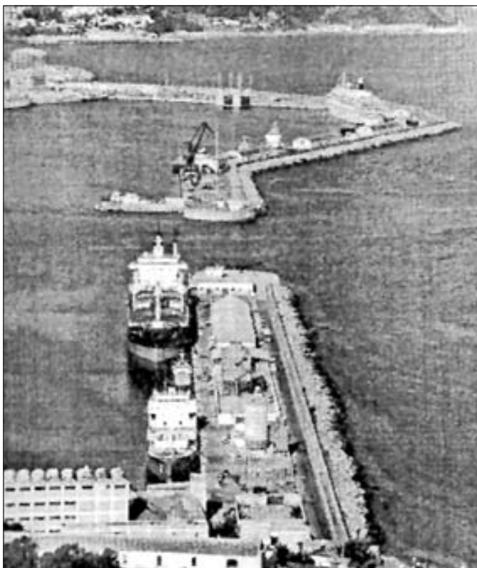
Panorámica Levante-Poniente en la actualidad

ponían a disposición de estos todo tipo de artículos que se embarcaban sin restricción alguna, situación que cambió injustamente con posterioridad.