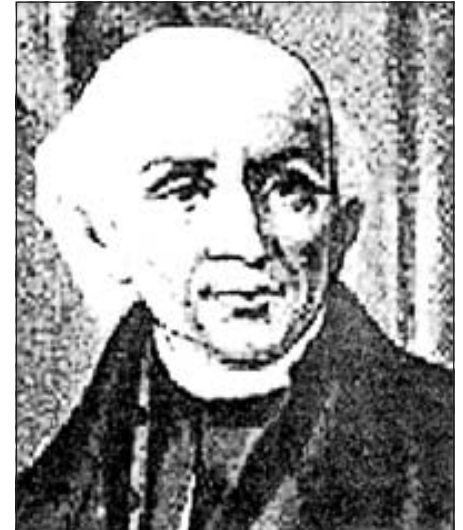
MIGUEL HIDALGO Y COSTILLA (1753-1811)

a la oficialidad del ejército, así como el estar constantemente presionados por los inmigrantes recién llegados, además de la promulgación del odiado 'Decreto de Secuestro de Fondos' (para sufragar la guerra) que permitió la toma de conciencia a los criollos de lo que México significaba para la metrópoli: "colonos nacidos para contentar la codicia nunca satisfecha de los españoles", hizo que muchos de ellos se convirtieran en líderes revolucionarios y que la invasión francesa del solar hispano, actuase como detonante de la revolución de 1810 en México, entablándose una lucha por el poder.