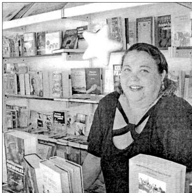
En la última Feria del Libro que vivió como librera.