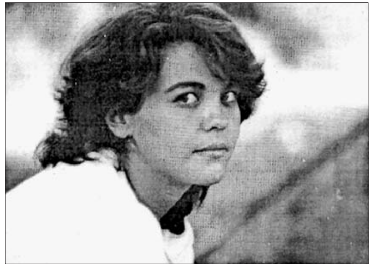
En su época de estudiante universitaria. La carrera la hizo en Cádiz y Sevilla