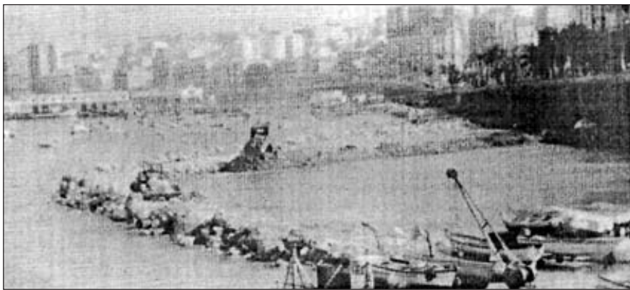
1970. Relleno de la explanada que albergará el CAS