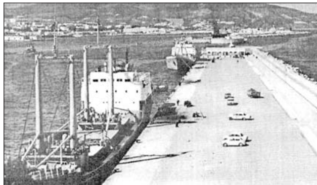
Panorámica Levante-Poniente en los años 70

Y las soluciones vinieron de manos del régimen de territorio franco, ahora tan olvidado como vulnerado. Antes del ingreso de España en la Unión Europea, los barcos hacían cola para repostar en el puerto de Ceuta porque los combustibles tenían precios extraordinariamente competitivos. Por otra parte, una extensa red de provisionistas de buques