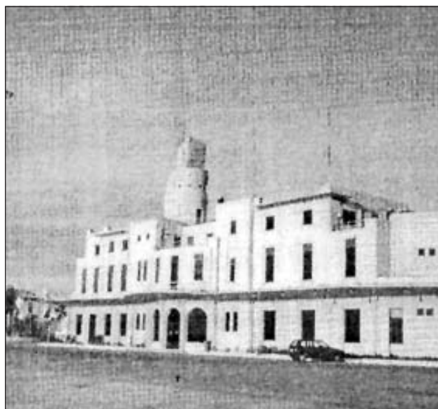
Edificio del Puerto finalizado en 1933