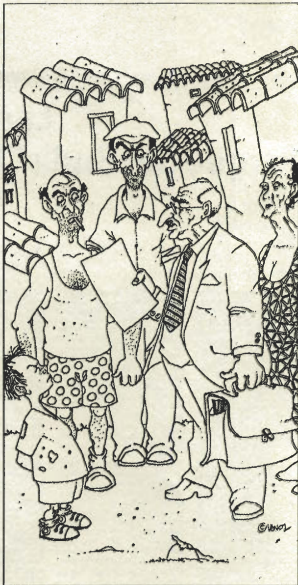
ILUSTRACIONES DE VICENTE ALVAREZ

Así que al principio de hacer las primeras obras, cuando el cobrador les anunciaba la llegada de don Marcial y que como viera todas las reformas que habían hecho sin permiso ni autorización les echaría sin ninguna contemplación, ellos muy asustados, casi cambiando de miedo, se apresuraban a de-