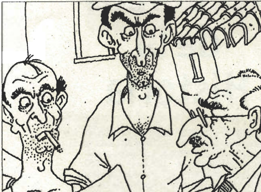
ILUSTRACION DE VICENTE ALVAREZ

Y el hombre de la cartera negra y las gafas de cristales gruesos parecía realmente conmovido y apesadumbrado.