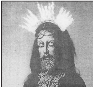
Medinaceli antiguo (J. de la Concepción)