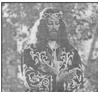
Medinaceli de los sucesores de Castillo