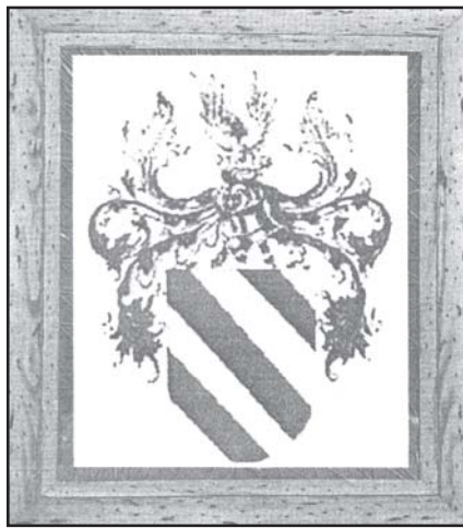
ESCUDO DE LOS ATAIDE, FAMILIA DE LA QUE PROCEDE EL ÚLTIMO TESTIMONIO HERÁLDICO CEUTÍ DE LA ÉPOCA PORTUGUESA.

Durante su reinado, entre 1751 y 1754, se reformó el Foso de la Almina y se colocó sobre su puerta este escudo junto al otro con las armas de España, por lo que no parece demasiado afirmar que fue esculpido en esa época, quizás como recuerdo del enloquecido monarca a su amada consorte.