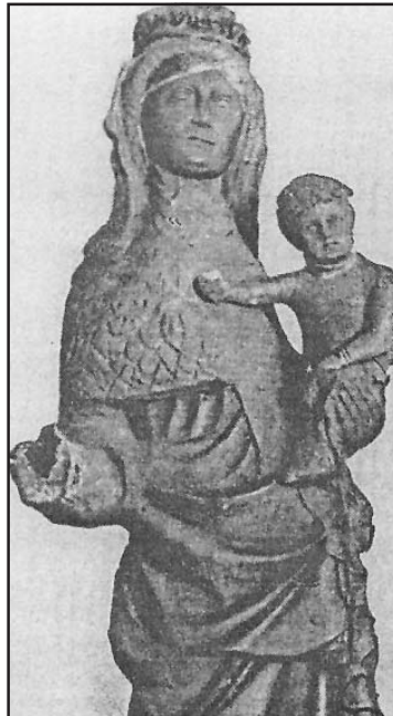
La Virgen del Valle antes de su última Transformación