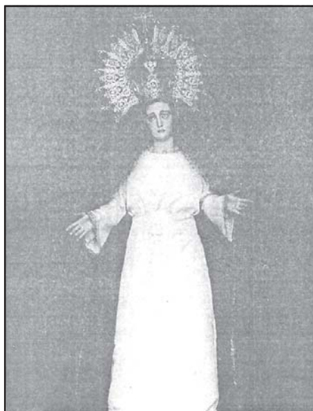
Nuestra Sra. del Desamparo antes de su conversión en imagen de candelero

Naturalmente, aquella imaginería estaba en los parámetros de su tiempo, es decir, esculturas de labra o talla completa, de tamaño menor y dedicadas lo mismo a Cristo, que a su Madre o a santos considerados necesarios por sus devotos para dirigir sus oraciones y peticiones a Dios, mediante su intercesión. Así, Santiago o San Jorge como ayuda en la guerra aparecen en la dedicación de los dos primeros conventos, mientras que San Simón y San Judas, San Roque o San Blas serán algunos de los protectores contra las enfermedades, sin olvidar a Santa Lucía o a Santa Catalina.