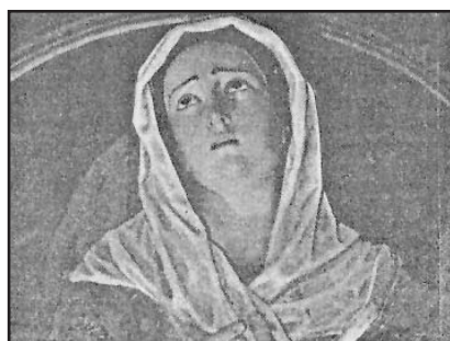
Ntra. Sra. del Calvario

Ejemplos de este tipo de imágenes pueden ser la talla de Nuestro Padre Jesús Cautivo y Rescatado, el popular Medinaceli, que labrara el hermano Juan de la Concepción de Córdoba, o las antiguas dolorosas de la Catedral y el Santuario de Nuestra Señora de África, de rostros tristes, mirada baja y las manos unidas, con sus dedos entrelazados, conteniendo su dolor en todas sus formas.